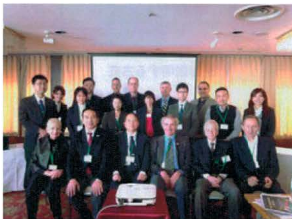
ワークショップ参加者の集合写真

今回のワークショップを通じて、色覚検査のあり方を巡って、交通モードの違いによる適用基準の相違は大きく影響しないことが示唆された。さらに、船員の色覚に関する短期的課題の解決と人間の色覚メカニズムの本質に基づく基準作りに迫る長期的課題として策定された意義は大きいと言える。新たなTCの発足による課題解決に向けた取り組みを関係者と共に推進する。