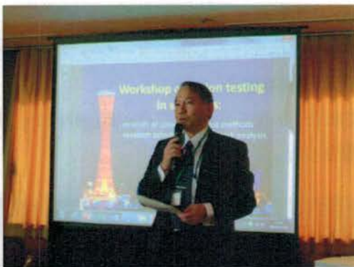
主旨説明する古荘

以上から、2017 年までに船員の色覚検査に対応した内容に CIE143 を改訂することを目的としてワークショップを開催した。このワークショップでは、CIE143 が交通分野全体を対象としているため、今回のワークショップの scope を海上交通に限定するのか、交通分野全体とするのか質問があり、海上貨物輸送に関する海上交通に限定することが確認された。