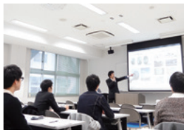
OB・OGによる説明会。学生は卒業生と交流し、有用な情報を得ることができます。

学級指導教員(クラス担任教員)が、個別にきめ細かく就職指導します。学部事務室では、求人票の提供や、各種証明書の発行など、就職活動をサポートするほか、求人情報・会社情報を自由に閲覧することも可能です。