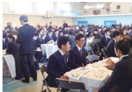
150社以上の企業が参加する就職ガイダンス。単独学部でこのような大規模なガイダンスを行うことは珍しく、社会からの関心・期待が高いことがわかります。

学部3年生と大学院博士課程前期課程1年生を主な対象に、学部独自のさまざまな就職ガイダンスを年数回実施。企業担当者による講演や自己分析テスト、面接・筆記試験対策のほか、深江キャンパスで「合同会社説明会」を開催しています。